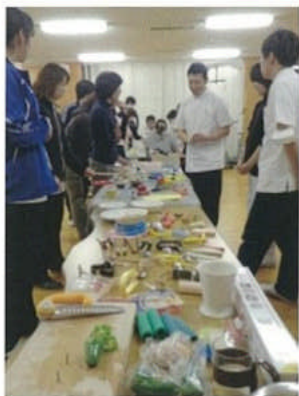
講座の様子(自助具の紹介)

リハビリテーション科では、平成19年度から平成24年度にわたり地域で活躍されているケアマネジャー、ホームヘルパー、患者様のご家族を対象とした公開講座を開催してきました。これまでのテーマとしては、「移乗動作の介助方法」、「腰痛予防法」、「座位のメカニズム」などを行ってきました。最近では「脳卒中」をキーワードに理学療法・作業療法・言語聴覚療法の視点から、症状の説明や車いすの工夫、日常生活動作、嚥下障害などについても情報提供をさせていただきました。リハセンター公開講座では一方性の情報提供ではなく、地域で活躍されている方々と可能な限り情報交換、コミュニケーションを図っていくことを心がけております。今後も開催していきたいと思っておりますので、ご参加・ご意見などをいただければ幸いです。