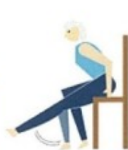
関節の曲げ伸ばし